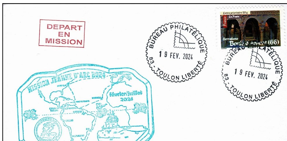
Cachet en bleu-vert du PHA TONNERRE

Sauf contre temps, chacune des escales devrait faire l'objet d'un pli commémoratif que nous ne manquons pas de vous présenter dès sa réception.